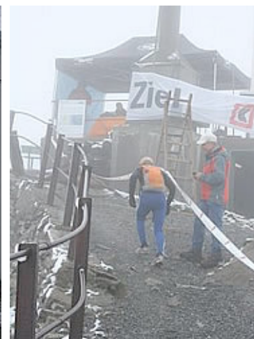
Die letzten Meter zum Ziel

Überholt wird durch den Ruf Treppe. Der Vordermann hält kurz an, macht Platz, und weiter geht's. Im Ziel angekommen, gibt es dann eine freundliche Begrüßung, heißen Tee oder Bouillon und ein Geschenk. Danach nichts wie zurück zur Bergstation, denn dort warten die trockenen Sachen, die mit der letzten Bahn zum Gipfel gebracht werden. Ab jetzt ist Relaxen im wunderschönen Gipfelhaus des Niesen angesagt.