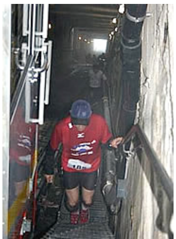
Treppende an der Bergstation