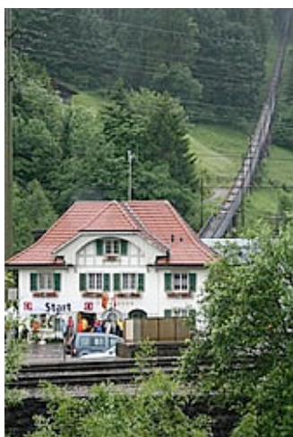
Start Talstation Niesenbahn - im Hintergrund die Treppe

Gestartet wird an der Talstation der Niesen Bahn in Mülönen auf 693 Meter Meereshöhe. In diesem Jahr bei Nebel und Dauerregen. Auch der Blick auf den Monitor am Start versprach Minustemperaturen am Ziel und damit Schneefall. Prost Mahlzeit.