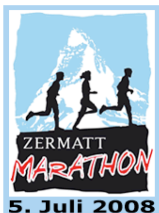
Banner anklicken - informieren Zum LaufReport 2007 HIER

Der markantste Berg am Thuner See, der 2364 Meter hohe Niesen im Berner Oberland, wurde zwischen 1906 und 1910 durch den Bau einer Standseilbahn erschlossen. Entlang der Seilbahn entstand eine Versorgungstreppe mit insgesamt 11.674 Stufen, bestehend aus Natursteinen und Gitterrosten. Kurzum die längste Treppe der Welt.