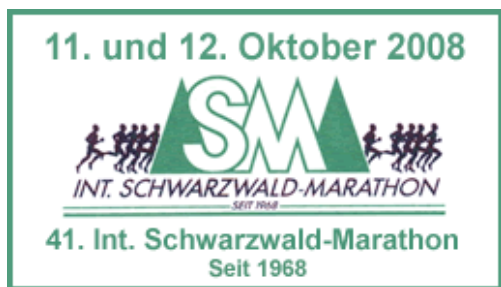
Banner anklicken - informieren LaufReport Schwarzwald Marathon `07 HIER

Zum Abschluss geht es dann mit der Seilbahn zurück (im Startgeld von 47,- SFR ist die Rückfahrt inbegriffen) zum Start. Dabei kann man nochmals auf bequemere Art und Weise die Strecke begutachten. Wieder unten angekommen juckt es jetzt schon wieder in den Füßen und Oberschenkeln.