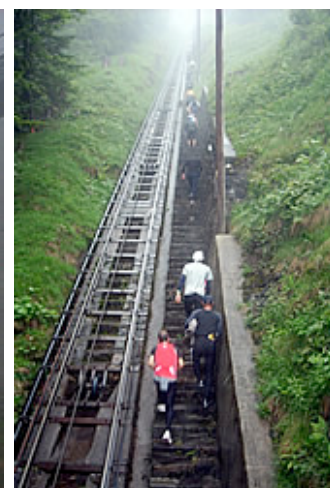
Die Treppenameisen nach der Mittelstation

Gutes Aufwärmen ist angesagt, denn zum Einlaufen hat man nach dem Start keine Chance mehr. Ab 7.30 Uhr (Startnummernausgabe ab 6.00 Uhr) werden jeweils 2 Teilnehmer in 20 Sekunden Abständen auf die Treppe gelassen. Alle Frauen zuerst