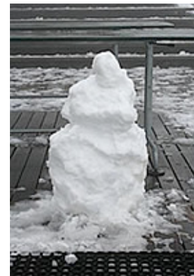
Schneekristalle für alle Treppenläufer - und 2009 hoffentlich besseres Wetter