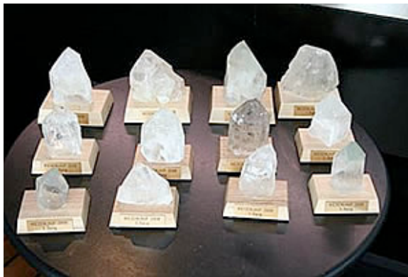
Bergkristalle für die Sieger