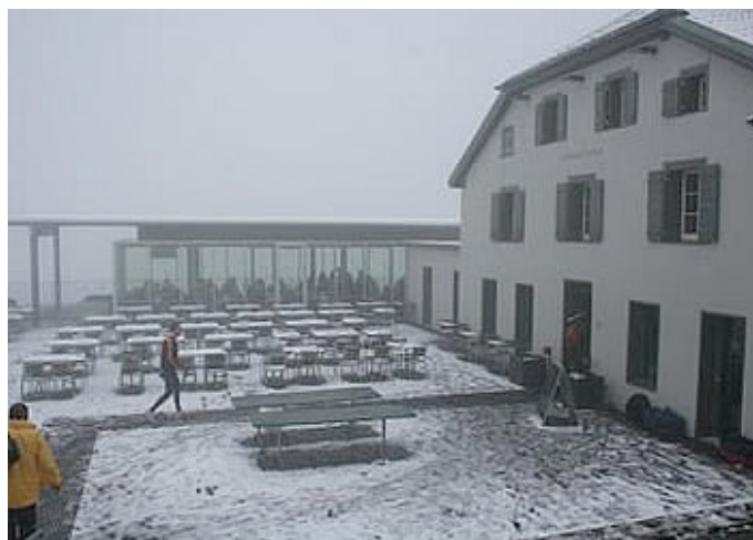
Niesenberghaus im Schnee