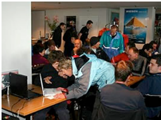
Auswertung mitten unter den Teilnehmern