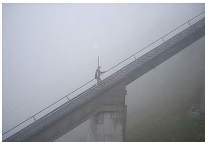
Stairway to Heaven